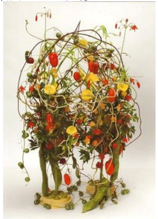
東京マイスター知事賞受賞作品

東京マイスターとは、都内に勤務する技能者のうち極めて優れた技能を持ち、他の技能者の模範と認められる方々を東京都優秀技能者として知事が認定するものです。毎年、中小企業における技能者の育成等を図るとともに、広く社会一般に技能尊重の気風を浸透させ、技能者の社会的地位及び技能水準の向上を図ることを目的として表彰を実施しています。